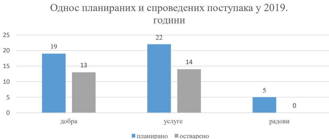
Графикон број 1: Однос планираних и спроведених поступака по врстама поступка у 2019. години

У наредној табели је дат преглед јавних набавки које су биле предмет ревизије, а које