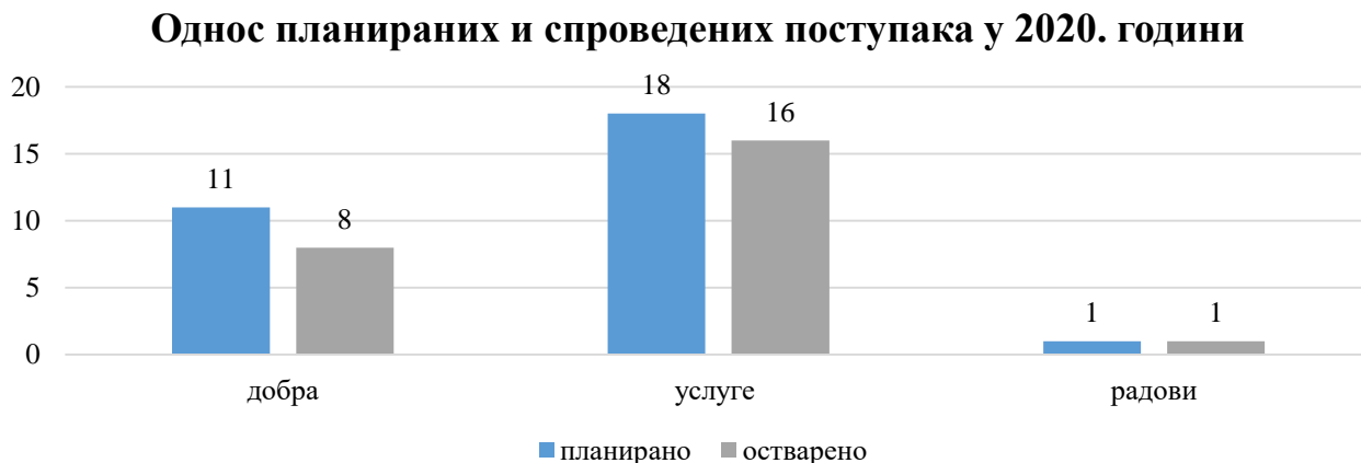
Графикон број 3: Однос планираних и спроведених поступака по врстама поступка у 2020. години

У наредној табели је дат преглед јавних набавки које су биле предмет ревизије, а које су спроведене у 2020. години по плану јавних набавки за 2020. годину и делом по плану за 2019. годину.